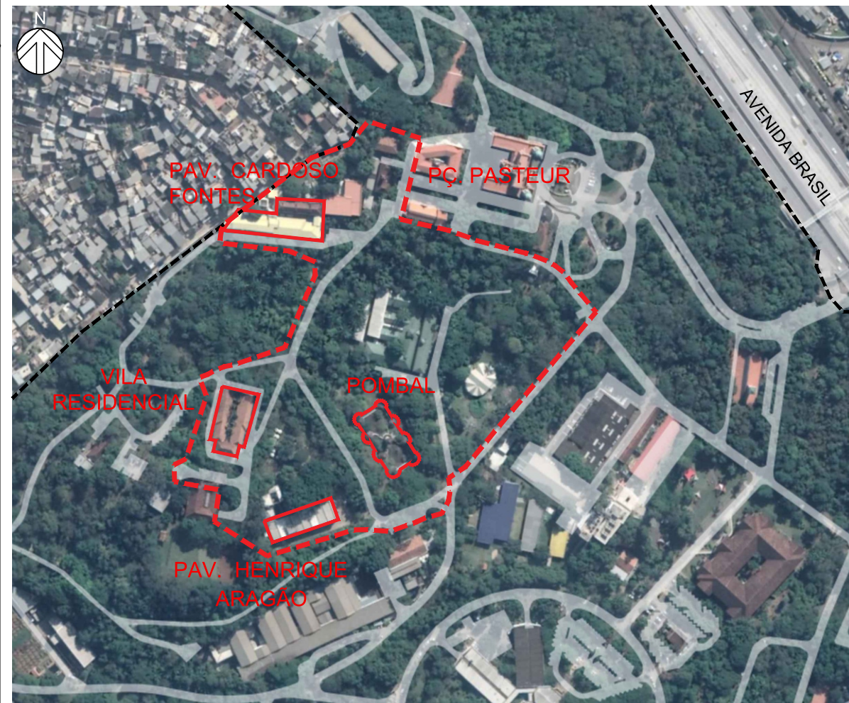
2 PLANTA DE SITUAÇÃO