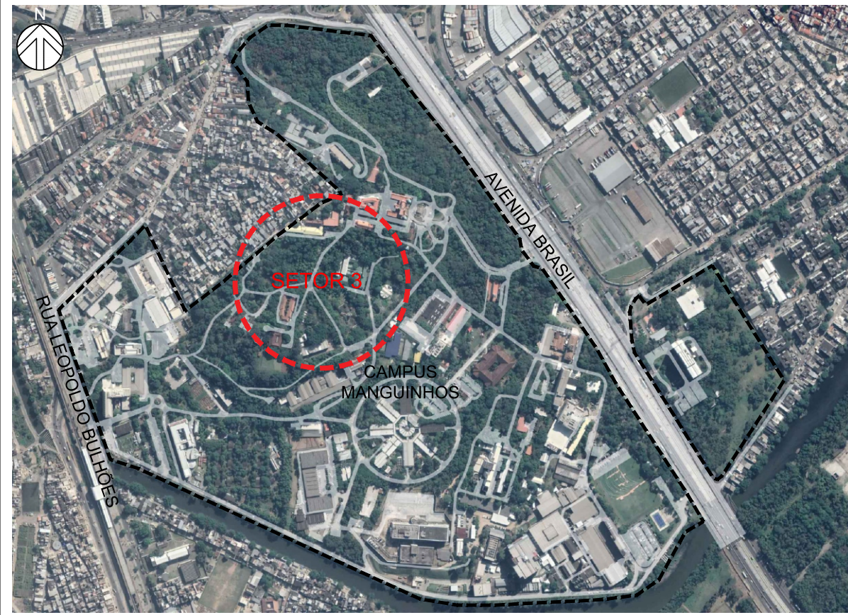
1 PLANTA DE SITUAÇÃO