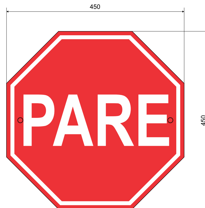
LAYOUT DA PLACA ESC.: 1:5