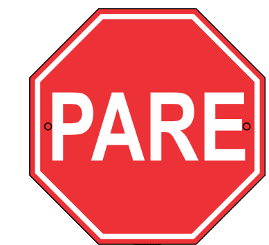
VISTA FRONTAL ESC.: 1:10