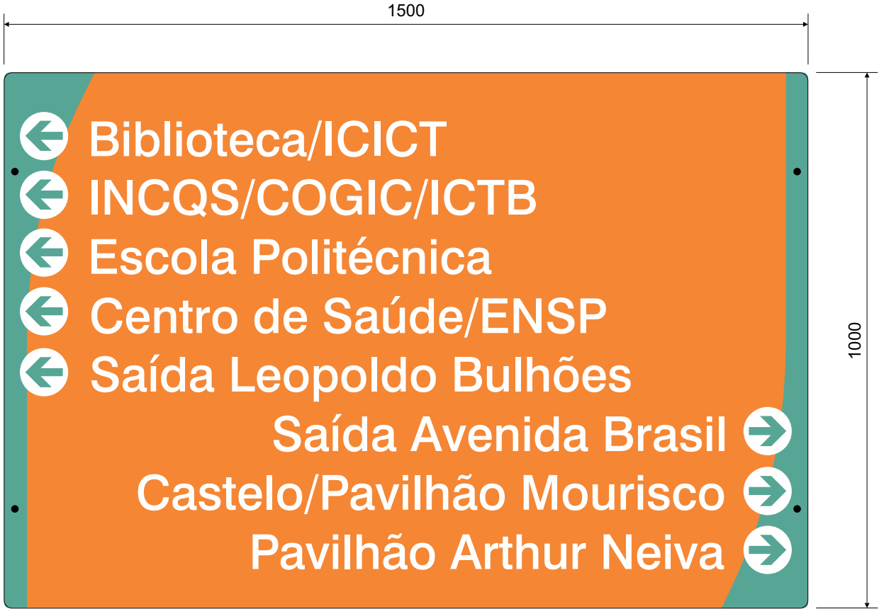
VISTA DA PLACA FRONTAL ESC.: 1:10