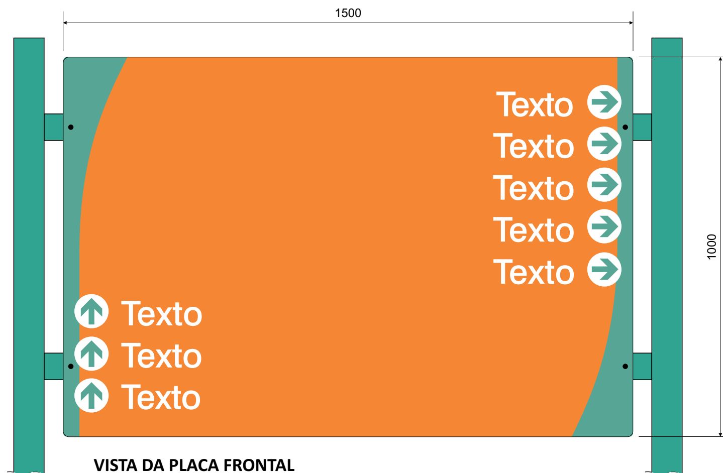
VISTA DA PLACA FRONTAL ESC.: 1:10