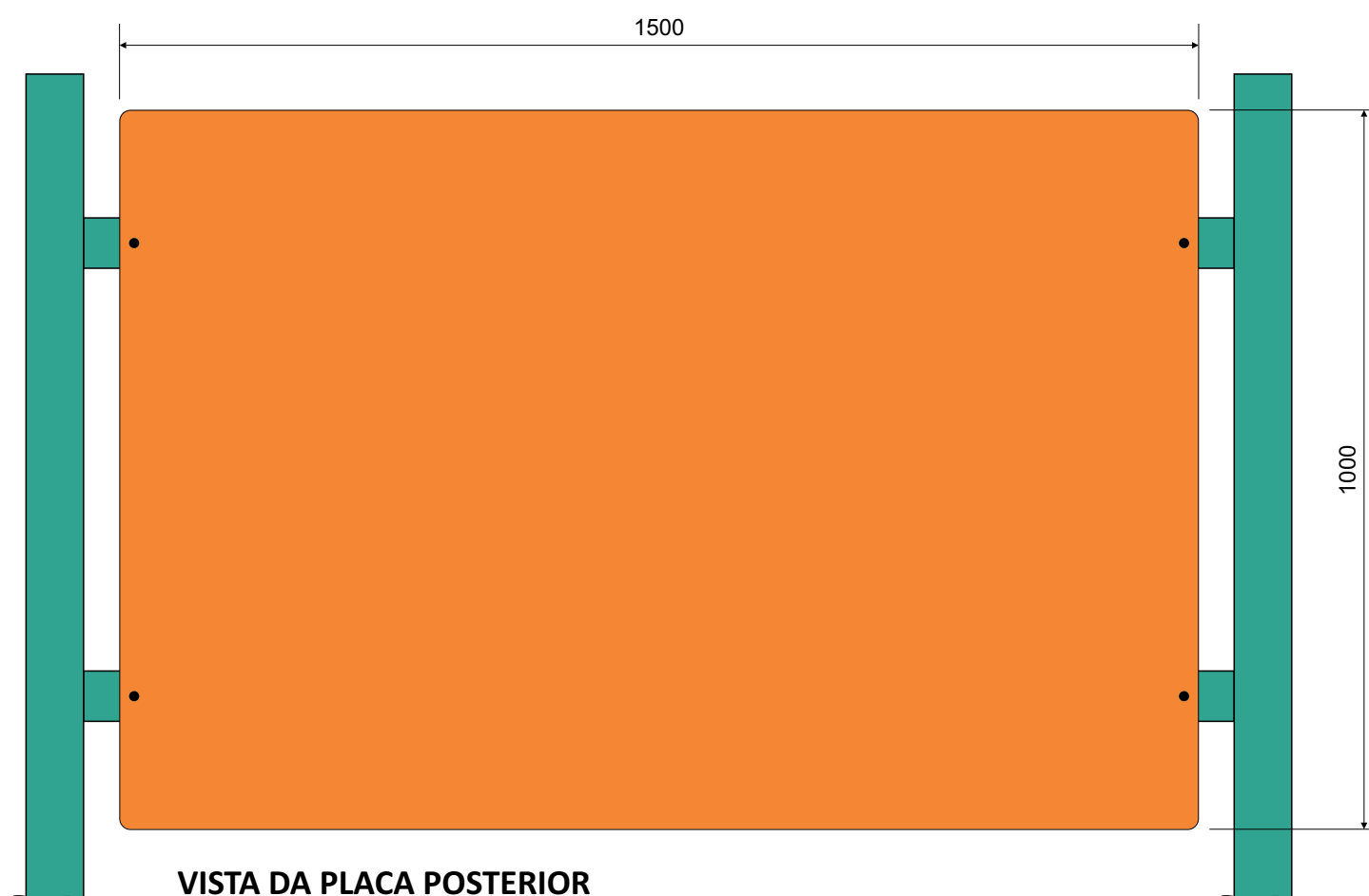
VISTA DA PLACA POSTERIOR ESC.: 1:10