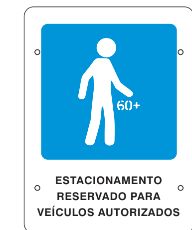
VISTA FRONTAL ESC.: 1:10