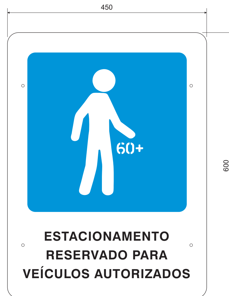
LAYOUT DA PLACA ESC.: 1:5