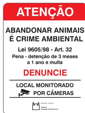
VISTA FRONTAL ESC.: 1:10