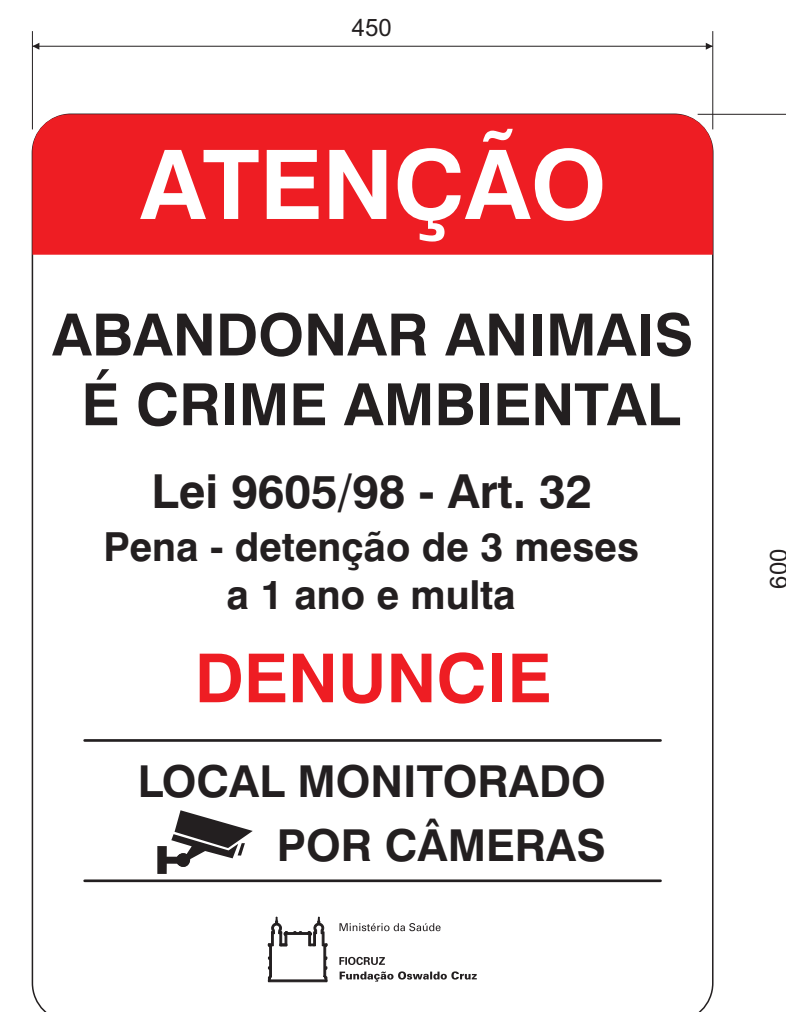
LAYOUT DA PLACA ESC.: 1:5