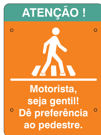
VISTA FRONTAL ESC.: 1:10