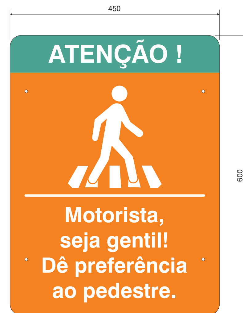
LAYOUT DA PLACA ESC.: 1:5