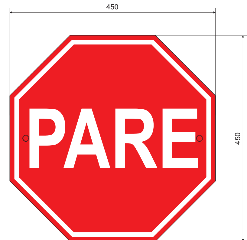
LAYOUT DA PLACA ESC.: 1:5